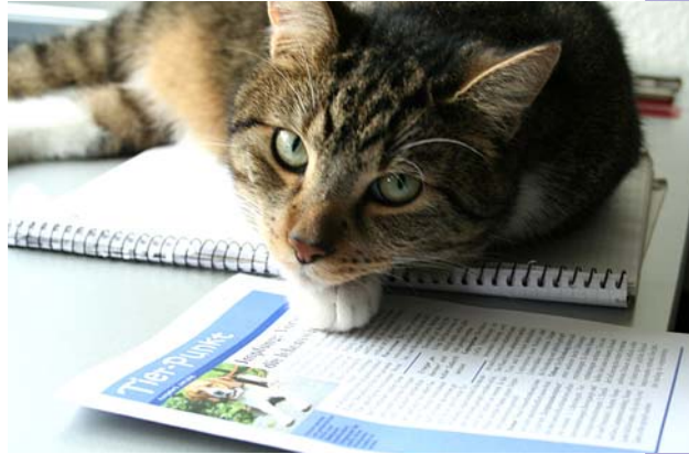
Kater Elvis ist noch häuslicher geworden.

Da ich bei einem größeren Ausflug von unserem unliebsamen Nachbarskater „vermöbelt“ worden bin und mich der Tierarzt erst einmal krank schreiben musste, war ich in meinem geliebten Garten einige Zeit nicht einsatzfähig.